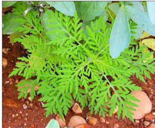
Les feuilles de l'ambroisie sont profondément découpées, du même vert sur les deux faces, sans odeur au froissage.

Marine Haas, de la FREDON (Fédération régionale de défense contre les organismes nuisibles), rappelle la dangerosité de