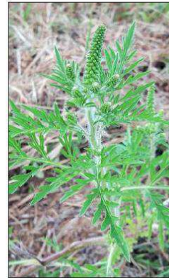
Les fleurs mâles sont positionnées sur de longs épis.

jonctivité, asthme, eczéma. Par ailleurs, elle peut aussi pénaliser le développement de l'agriculture durable, car elle colonise certaines cultures, ce qui entraîne des baisses de rende-