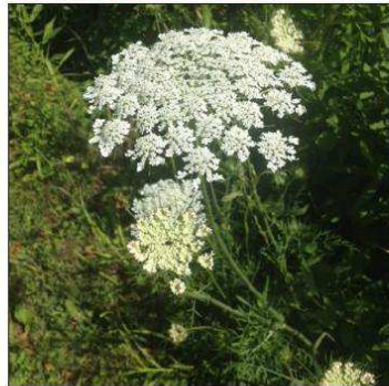
Cette plante invasive peut atteindre cinq mètres de haut.

Fleurs blanches, sur une même tige, avec des ombelles allant jusqu'à 50 cm, une tige robuste et creuse, avec des poils blancs : méfiez-vous !